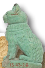
amulet z kotem, 664–380 r. p.n.e.