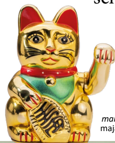
maneki-neko, figurka kota mająca przynosić szczęście

Co spowodowało, że dwa gatunki postanowiły współpracować? Ludzie mieszkający w tamtym czasie na Bliskim Wschodzie zaczęli prowadzić osiadły tryb życia, czyli zamiast polować i prznosić się z miejsca na miejsce, żeby zbierać i jeść rośliny rosnące w okolicy, zakładali pierwsze stałe osady i samodzielnie uprawiali ziemię. Niestety okazało się, że przechowywane plony przyciągają szkodniki i gryzonie. Koty, które żywią się mniejszymi zwierzętami, zorientowały się szybko, że w pobliżu ludzkich osiedli jest dla nich dużo myszy do upolowania, więc zaczęły częściej przebywać w pobliżu człowieka i... dalej poszło już łatwo. Ludziom zależało, żeby koty strzegły zapasów przed gryzoniami, a koty chętnie korzystały z dostępu do pokarmu i ze schronienia.