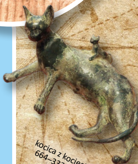
kocią z kocięciem, 664–332 r. p.n.e.

W starożytnym świecie koty doczekały się szczególnej pozycji, zwłaszcza w Egipcie. Otaczano je swego rodzaju czcią. Pod postacią kota przedstawiano boginię o imieniu Bastet – było to bóstwo miłości, radości, tańca, muzyki i ogniska domowego. W miastach istniały świątynie pełne kotów, a ludzie celowo dokarmiali te zwierzęta. Zabijanie mruczków zostało surowo zabronione! Jeśli w jakimś domu kot naturalnie zakończył życie, rozpoczynała się oficjalna żałoba – domownicy golili wówczas brwi na znak przeżywanego smutku.