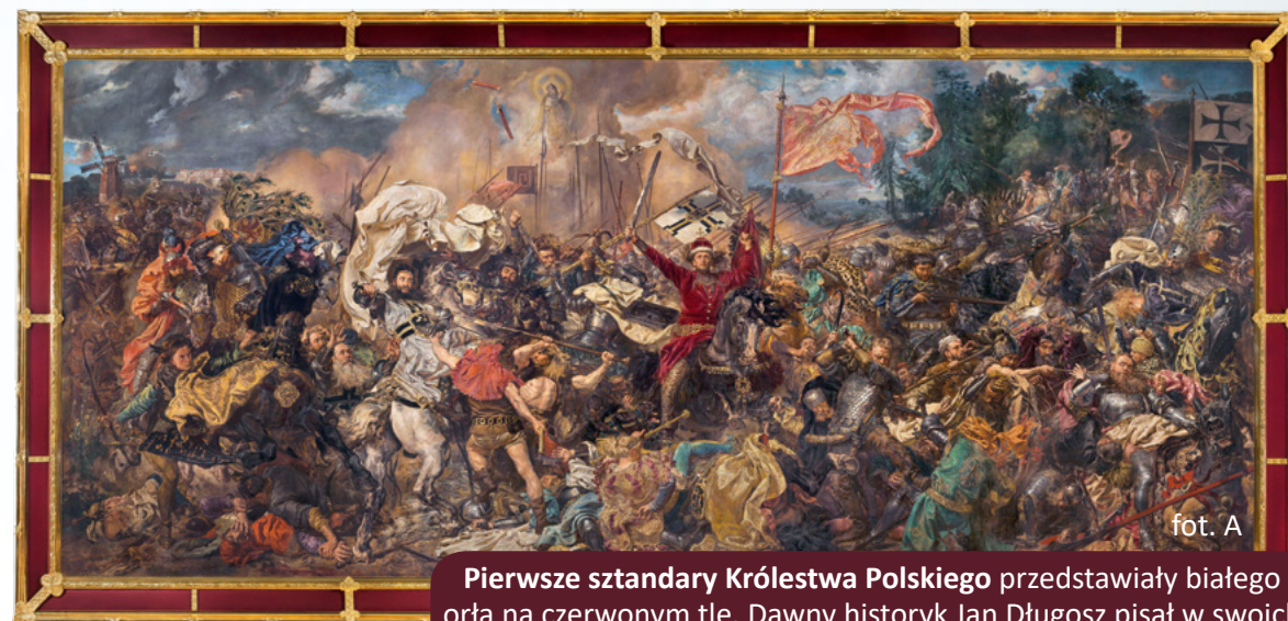
Jan Matejko, Bitwa pod Grunwaldem

Współczesne flagi wywodzą się od sztandarów , a te pochodziły od bardzo, bardzo dawnych znaków używanych na polach walk. Dzięki nim walczący się rozpoznawali, a wodzowie mogli wydawać komendy swoim wojskom.