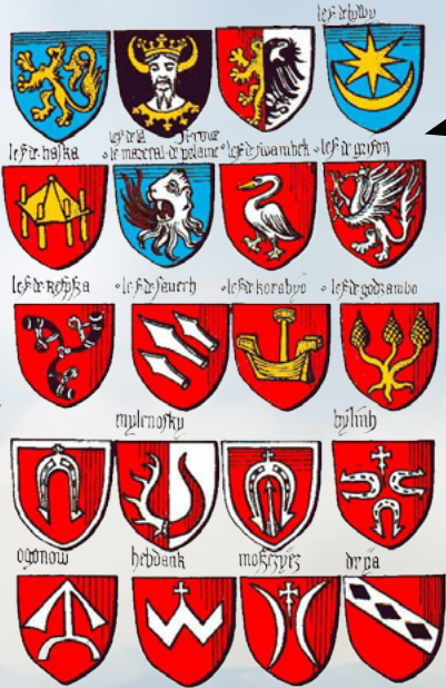
herby polskich rodów szlacheckich